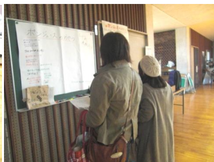
食育遊び・絵本コーナー ポンジュースしぐれ試食