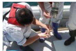
北原式採水による採水

小型船舶「いたしま 2」で魚類養殖場にて、北原式採水器を用いて表層、5 m 層を採水した。測定は、ウインクラー法・アジ化ナトリウム変法において行い、DO 固定は、船上で行い、滴定は、実験室で行った。