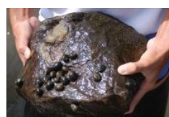
指標生物：イシマキガイ 水生生物による水質判定

水生生物による水質調査は、宇和島市の住宅部に位置する三島橋周辺と溪谷部の薬師谷川の岩戸橋周辺を定点とし、9 月の第 3 週間後を測定日とした。調査人数は、10 名前後、採集時間は、約 30 分とした。