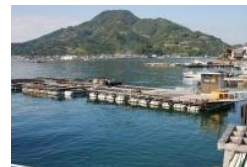
観測地点「学校浮き桟橋」 観測地点「坂下津生簀」