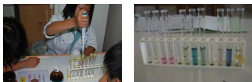
比色定量法による栄養塩類の測定