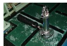
STDによる水温・塩分の鉛直測定