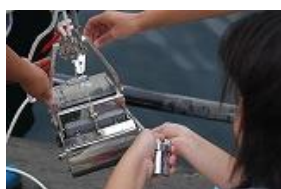
エクマンバージ採泥器