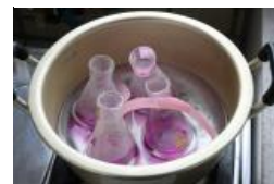
沸騰直前での加熱