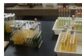
培養後の乳糖ブイオン培地