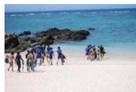
亜熱帯水生生物観察実習