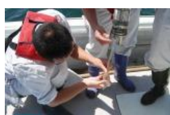
北原式採水器による採水

比重は、水温と比重によって塩分および塩素量が求められる。その際、日本では、温度を1.5℃換算した標準比重を海洋観測常用表から求め、塩分・塩素量を算出している。本校は、GLOBEの塩分濃度換算表から塩分濃度を算出した。