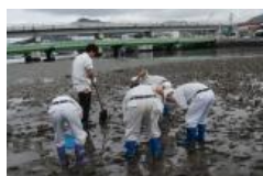
干潟生物採集実習

愛媛県レッドデータブックに記載されている甲殻類などたくさんの水生生物を確認することができた。