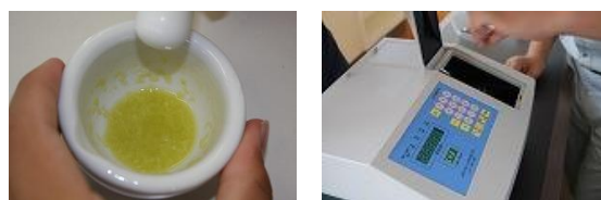
アセトン溶液による色素の抽出