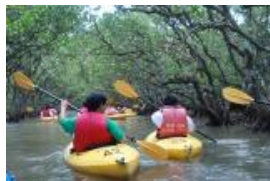
マングローブカヌー実習