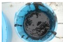
硫化水素を多く含んだ泥

冷凍保管した底泥を電子天秤で正確に測定し、少量の蒸留水でガラス製ガス発生装置の中に挿入した。その後、18N (18 規定) の硫酸を 1 ml 添加し、検知管法により、硫化水素を測定した。