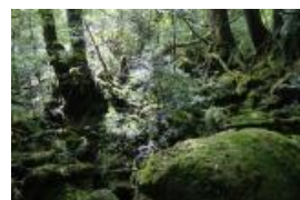
屋久島 もののけ姫の森