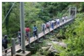
屋久島白谷雲水峡山体験実習

また、プランクトンネットで 10m 鉛直曳きを行い、各地点のプランクトンを採集した。