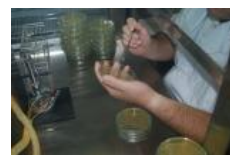
火炎下での培地の分注 クリーンベンチでの無菌操作