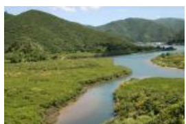
奄美大島マングローブ原生林