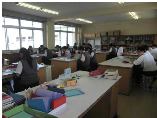
手紙を書く活動「ご協力ありがとうございました。」