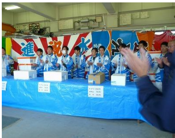
まもなくマグロの販売開始