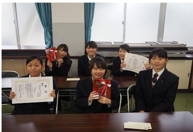
優秀賞を受賞した本校生徒